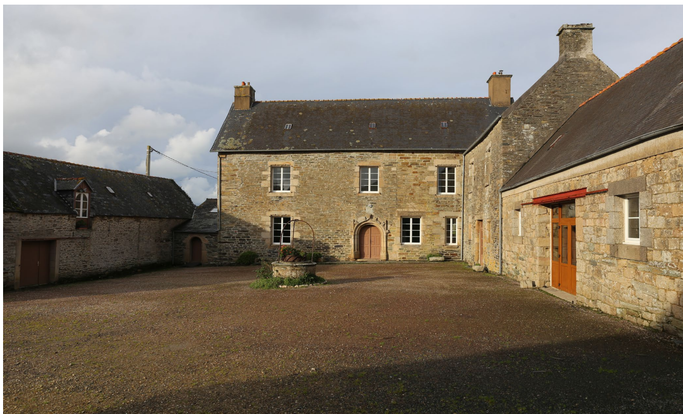
LE MANOIR DE PORSPODEN À PLESTIN-LÉS-GRÈVES, FÉVRIER 2020

Installée dans ses nouveaux quartiers, La Grange Vadrouille souhaite créer au Manoir de Porspoden, un tiers-lieu associant l'événementiel à une restauration responsable, accessible à tous et ainsi œuvrer au développement de la vie culturelle locale. L'ouverture des portes est prévue au Printemps 2022.