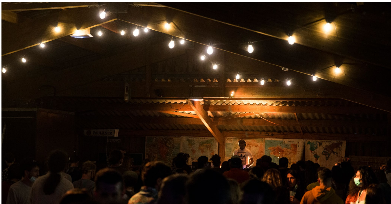
LE CONCERT DE GUTS À LA GRANGE DU GWASKELL À LOCCQUIREC, ÉTÉ 2020

Dorénavant installée dans ses nouveaux quartiers, La Grange Vadrouille travaille à ce qui a fait son ADN lors de sa création : développer au Manoir de Porspoden un tiers-lieu vivant et festif, ouvert à tous et associant l'événementiel à la restauration.