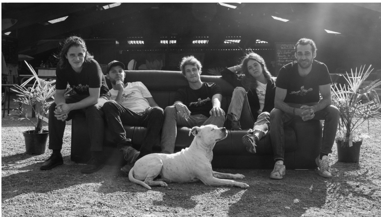
L'ÉQUIPE DE LA GRANGE VADROUILLE À LA GRANGE DU GWASKELL, LOCQUIREC, SEPTEMBRE 2020, PHOTOGRAPHIE © MARC RIOU

La genèse du projet remonte au mois de Mars 2020 à Locquirec, dans le Finistère, en Bretagne.