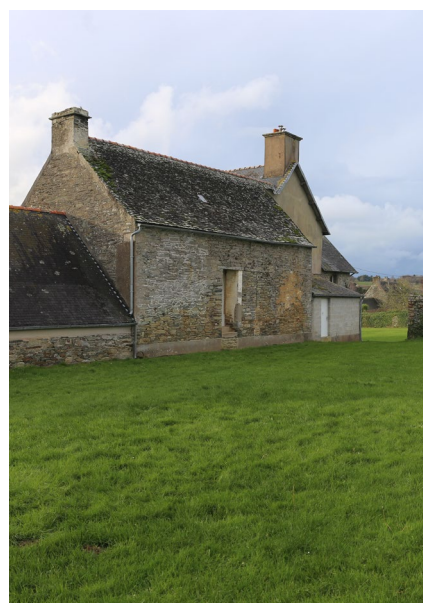
LA GRANGE VADROUILLE A INVESTI LE GWASKELL À LOCQUIREC, ÉTÉ 2020, PHOTOGRAPHIES © MARC RIOU