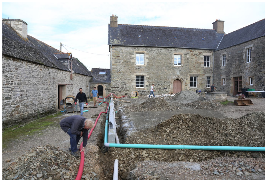
LE CHANTIER DU MANOIR DE PORSPODEN À PLESTIN-LES-GRÈVES, JUIN – DÉCEMBRE 2021